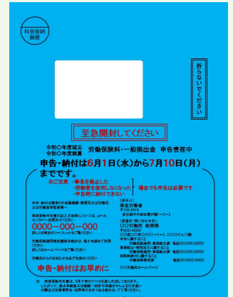
*上記の封筒はイメージです。

5月頃を目途に管轄の労働局から封筒が郵送されます。下記のいずれかの封筒が届きます。