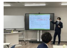
セミナー開催のイメージです。 お気軽にお問い合わせください。